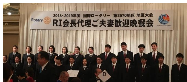
本庄東高等学校合唱部