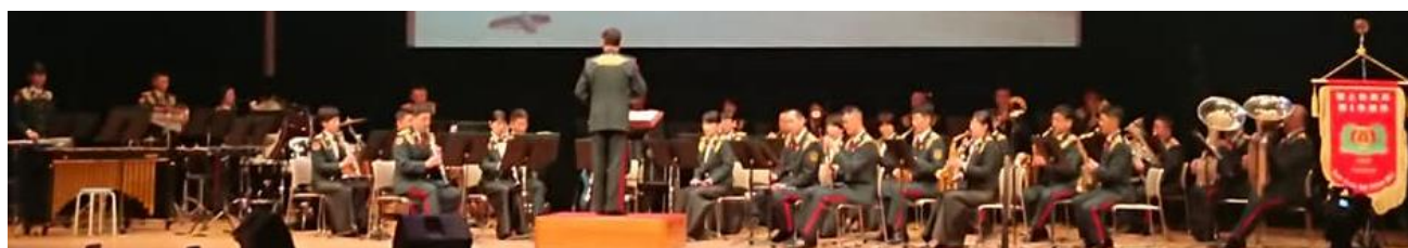
陸上自衛隊第1音楽隊